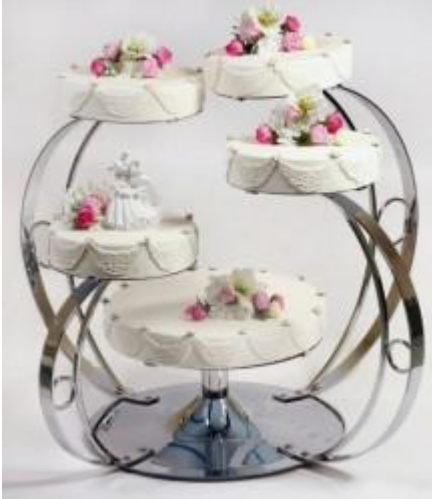
SMG 5 Suport metalic, nichelat, argintiu (5 etaje) Diametre farfuri: 1x 40, 4 x 26 cm, inaltime 67 cm Pret: 1900 ron + TVA