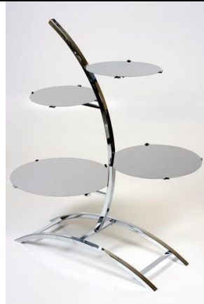
SMZ 4 Suport metalic, nichelat, argintiu (4 etaje) Diametre farfuri: 2x20, 26 si 32 Inaltime 58 cm Pret: 930 ron + TVA