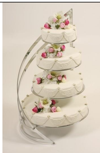
SMS 4 Suport metalic, nichelat, argintiu (4 etaje) Diametre farfuri: 20, 26, 32 si 40 cm Inaltime 70 cm Pret: 1000 ron + TVA