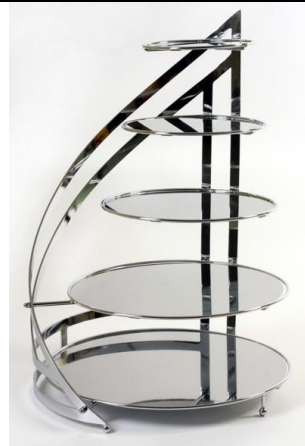
SMS 5 Suport metalic, nichelat, argintiu (5 etaje) Diametre farfuri: 20, 26, 32, 40 si 45 cm Inaltime 75 cm Pret: 1650 ron + TVA