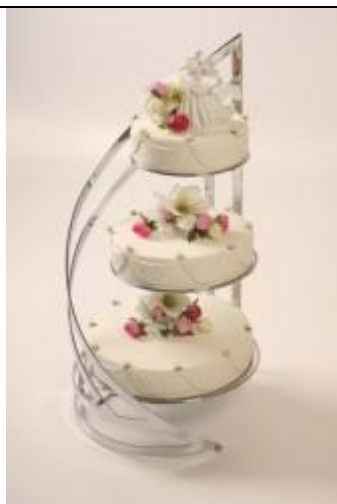
SMS 3 Suport metalic, nichelat, argintiu (3 etaje) Diametre farfuri: 20, 26 si 32 cm Inaltime 70 cm Pret: 850 ron + TVA

(Suportii de tort ce se aduc numai pe comanda, livrare in 2 saptamani de la comanda ferma)